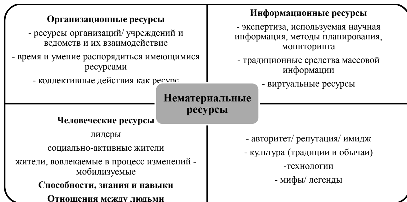
Рис. 2. Нематериальные ресурсы сообщества

К нематериальным ресурсам относятся также ресурсы тех учреждений, организаций, которые обычно существуют для каких-то своих целей, но могли бы использовать свой потенциал и возможности для всего сообщества. Их взаимодействие коллективные действия являются важным ресурсом успешности в достижении целей. Например, взаимодействующие общественные организации, участвующие в коллективных действиях, создают сеть, сформированную на общих принципах совместных действий и стратегий сотрудничества.