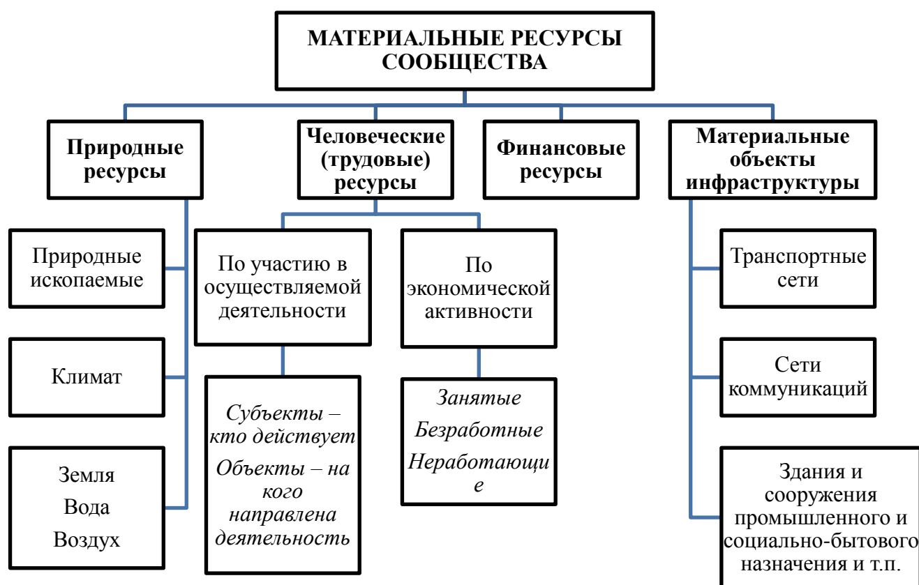
Рис.1 Классификация материальных ресурсов сообщества

В большинстве случаев, когда речь идет о развитии местного сообщества, не являющиеся с точки зрения экономической теории материальными человеческие и финансовые ресурсы принято относить к материальной группе ресурсов. Классификация материальных ресурсов сообщества представлена на рис.1.