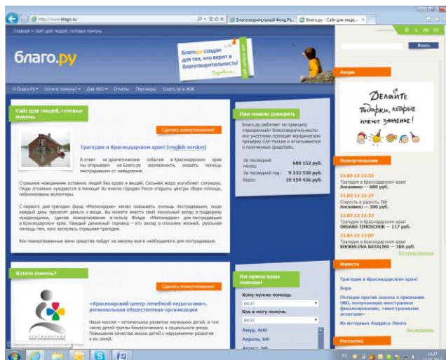
Рис. 6. Сайт Программы «Благо.ру», САФ Россия

На сайте опубликована информация о деятельности благотворительных организаций, новости текущих проектов, о том, кому и как они помогают. Программа организована и управляется филиалом Благотворительного фонда «Чаритиз Эйд Фаундейшн» — САФ Россия. САФ Россия гарантирует, что переведенные средства обязательно достигнут своего адресата, а их расходование будет целевым. Согласно Положению о Программе принять участие в «Благо.ру» может зарегистрированная в качестве юридического лица на территории РФ российская некоммерческая организация, которая занимается благотворительной или иной социально значимой деятельностью, имеет расчетный счет в банке и собственный сайт (страницу) в Интернете. Для составления заявления на участие в Программе можно воспользоваться регистрационной формой и отправить ее в САФ Россия по электронной почте. Средства, пожертвованные на реализацию Программы, расходуются САФ Россия следующим образом: 95% суммы пожертвования направляются на поддержку НКО, определенных жертвователем; 5% суммы пожертвования направляются на покрытие расходов по администрированию Программы, включая расходы по переводу пожертвованных средств посредством Интернет и с помощью пластиковых банковских карт (оплата комиссии банка, услуг провайдера, хостинг сайта и т.п.).