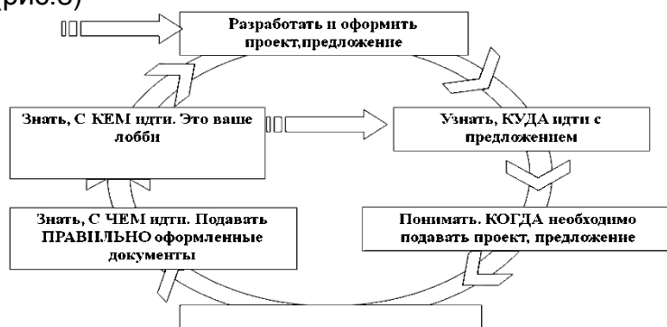
Рис.8 Алгоритм действий при привлечении бюджетных средств

На рис. Представлен алгоритм действий при привлечении бюджетных средств, уже известный вам по разделу 2.2.2. В случае выделения бюджетных средств на конкурсной основе ваша деятельность существенно не будет отличаться от алгоритма, описанного в разделе 3.4. (рис.8)