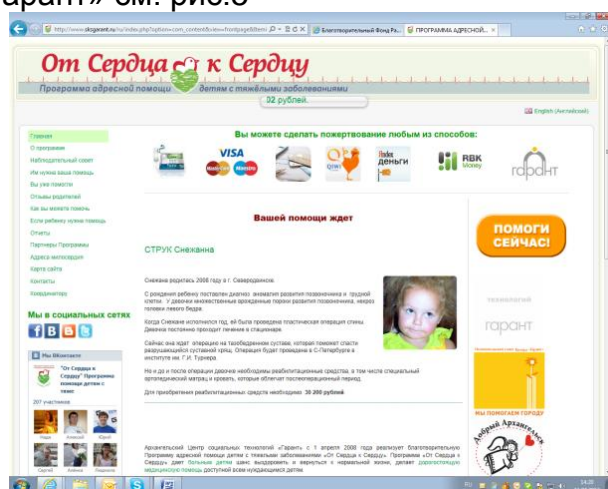
Рис.5 Сайт Программы сбора частных и корпоративных пожертвований, Архангельский Центр «Гарант»

Сбор средств на сайте организации/ благотворительной программы. Позволяет использовать практически любой способ электронного фандрайзинга. В качестве примера достаточно посетить сайт одной из Программ Архангельского Центра социальных технологий «Гарант» см. рис.5